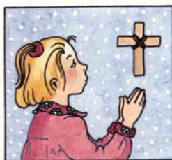
Francis Beltzung pour l'équipe d'evf

Pour clore la célébration, tout le monde s'est donné la main pour une grande chaîne d'amitié, nous avons récité une prière écrite par le Père Kurris et chanté: "... je t'ai appelé par ton nom, tu comptes beaucoup à mes yeux, tu es précieux pour moi car je t'aime..."